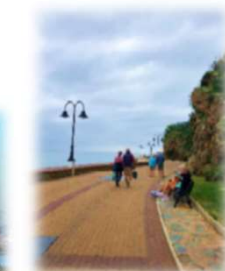
ビーチウォーク(マラガ)