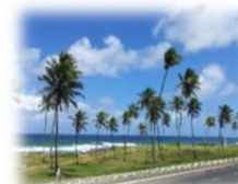
海岸沿いの遊歩道