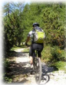
トレイル・ クロスカントリー