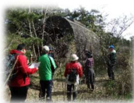
歴史学習・散策路