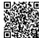
eラーニング研修推奨

https://poppins-education.jp/elearning/ →