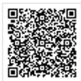
研修ホームページ