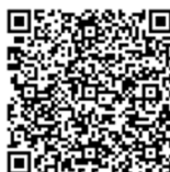
研修ホームページ