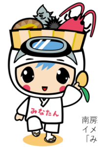
南房総市 イメージキャラクター 「みなたん」