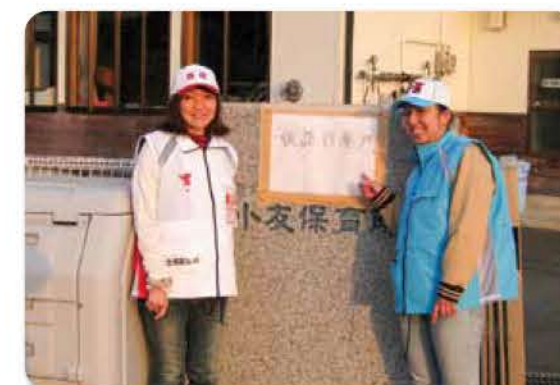
仮設診療所となった保育所前にて