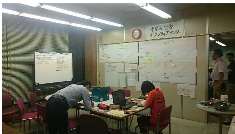
( 県災害ボランティアセンター活動スペース 及び 情報整理ボード )