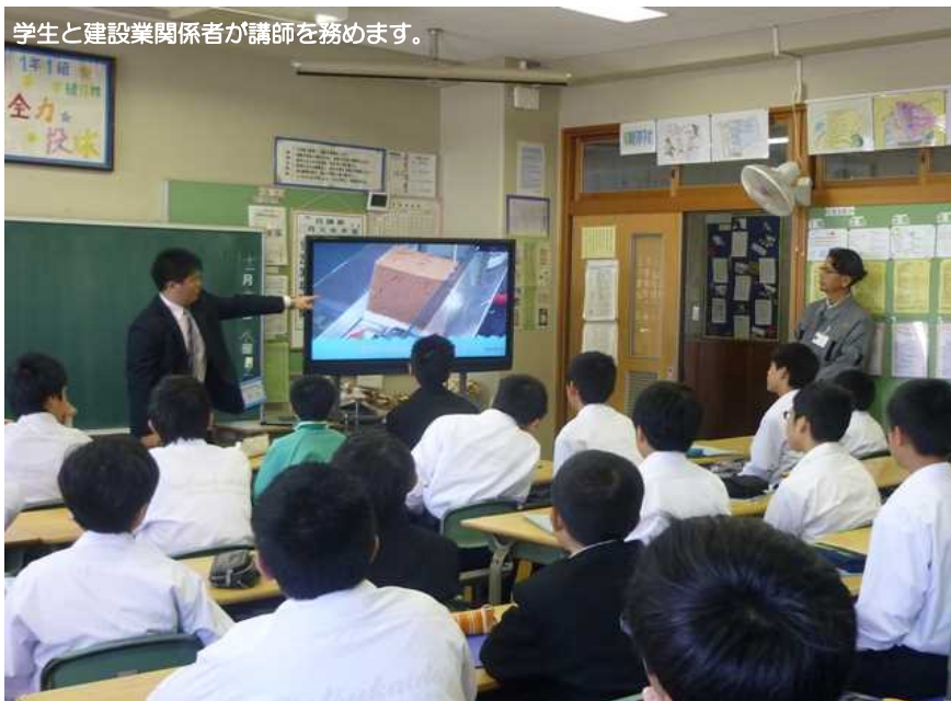
学生と建設業関係者が講師を務めます。