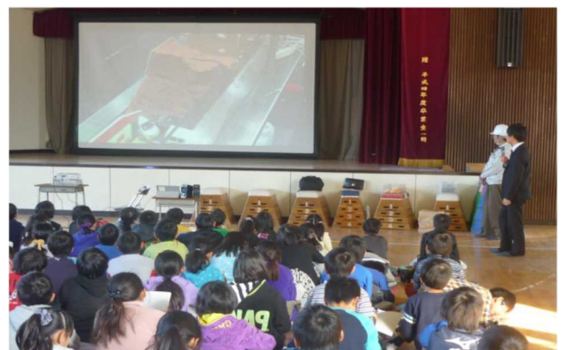
小学生も興味深々です。

その際には、前回の反省点や今後の方向性を、CCIちばとNPOが共有することを心がけました。