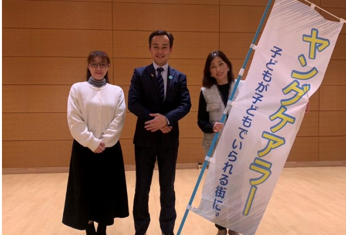
ヤングケアラー・シンポジウム開催 2023. 2. 4 浦安市民プラザ WAVE101