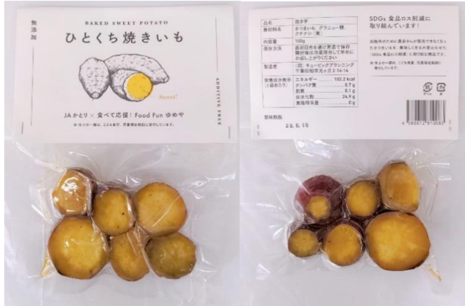
規格外野菜 さつまいもを商品化しました。