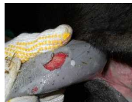
舌のびらん（黒毛和種）

39. 0度以上の発熱、流ぜん、口やひづめに水ほうやびらんなどがあれば、家畜保健衛生所へ届け出ることが義務化されました。