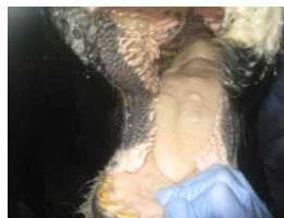
舌の水ほう（ホルスタイン種）