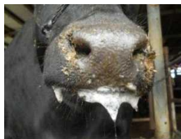
泡末性流ぜん（黒毛和種）