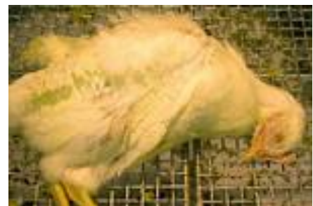
突然の死亡、 明らかな病変なし