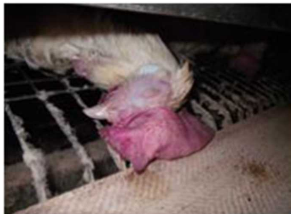
顔面・とさかの 浮腫・チアノーゼ