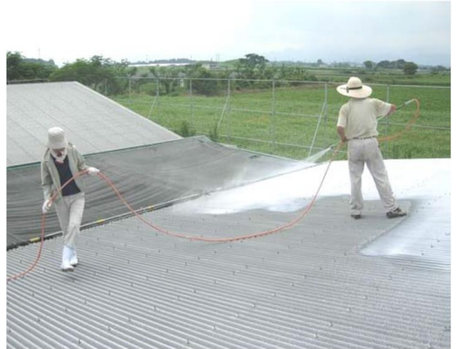
↑屋根への石灰の吹き付け

暑熱対策は畜舎管理面と飼養管理面の複数の対策を組み合わせるとより効果的です。早めの対策を行い、夏を乗り切りましょう！