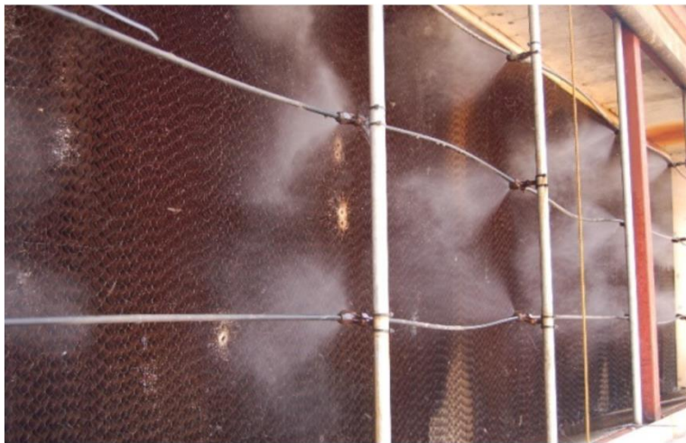
↑細霧装置による散水