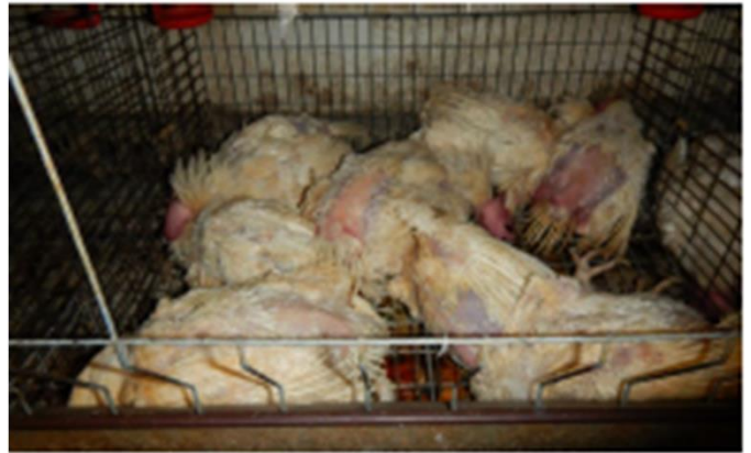
同一ケージ内での死亡