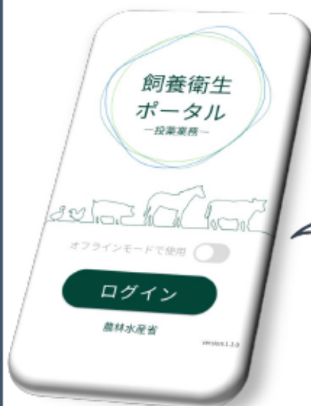
電子指示書作成画面