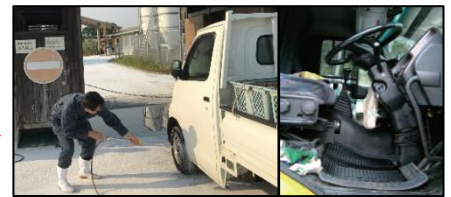
車両はタイヤだけでなく、 泥よけの内側まで消毒 し、 フロアマットの交換 や ペダル等車内も消毒