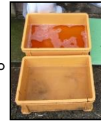
推奨される踏込消毒槽の設置方法