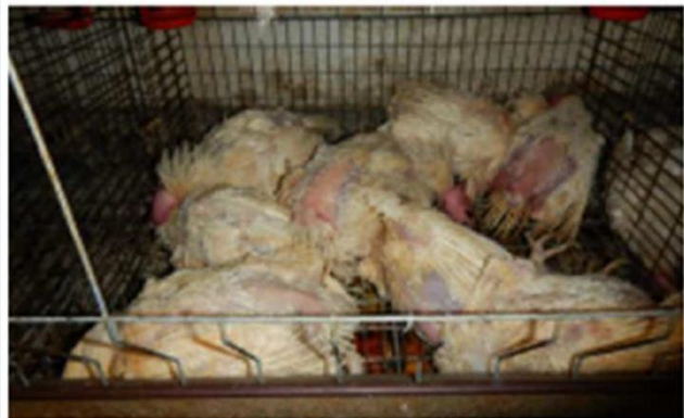
同一鶏舎内での死亡