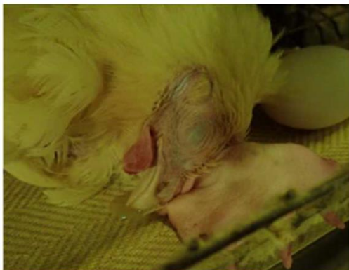
チアノーゼ・うずくまり