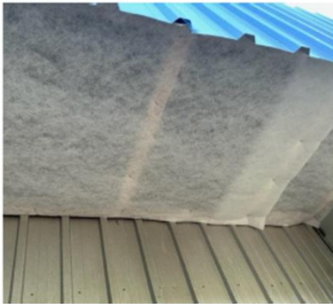
↑入気口フィルター