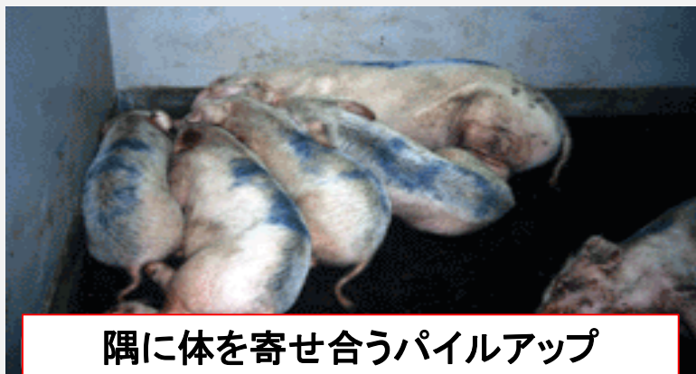
隅に体を寄せ合うパイルアップ