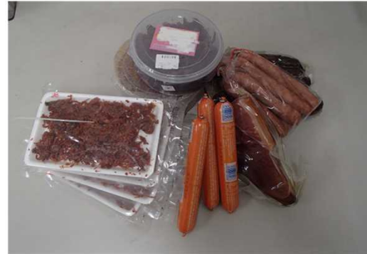
輸入禁止品 (ハム、ソーセージ等)