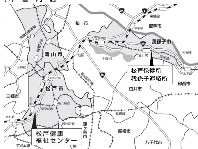
図3 - (1) 管内図

3 千葉県面積は平成23年版全国市町村要覧（総務省発行）に記載されている便宜上の概算数値による。