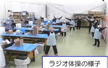
ラジオ体操の様子