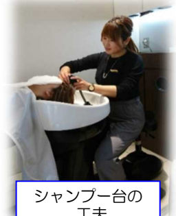
シャンプー台の工夫

二つ目は、「スポーツ大会の開催」。家族がいる従業員でも参加しやすいよう、家族も一緒に参加できる形での実施を検討しているそうです。健康に働き続けるためには、このようなイベントの開催で従業員同士のつながりを深めたり、ワークライフバランスの実現を目指す取組みも重要と考えているとのことでした。