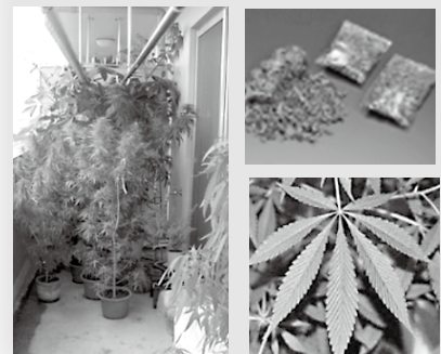
【不正に栽培された大麻】