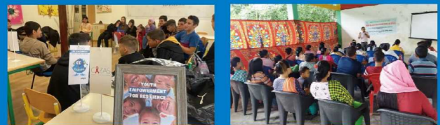
モンテネグロ：若者の参加によるワークショップ インド：家族対象の薬物乱用防止研修