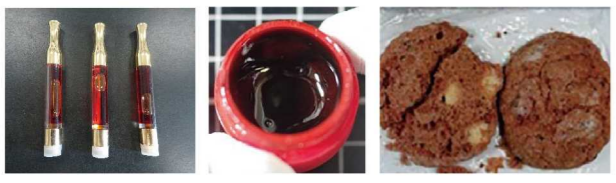
大麻リキッド 大麻ワックス 大麻クッキー

「大麻リキッド」「大麻ワックス」など大麻から幻覚成分を抽出・濃縮した加工品が摘発されています。また海外旅行のお土産としてもらったものでも違法です。