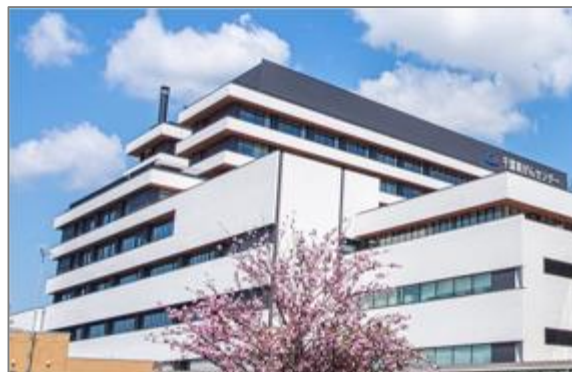
千葉県がんセンター

患者や家族の相談にワンストップで対応する患者総合支援センターも設置しており、患者等の利便性の向上を図るなど、県がん医療の中核的な施設となっています。