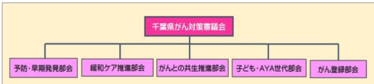
図表1-4-1: 千葉県がん対策審議会の組織