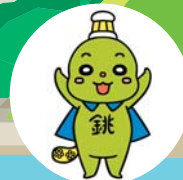
銚子市公認 マスコットキャラクター ちょーびー