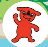
千葉県マスコット キャラクター チーバくん

はやし きく おう 講師/林家 木久扇氏 落語家/日本テレビ「笑点」 レギュラーメンバー 胃がん・喉頭がんを経験するも、 現在も精力的に活動中。