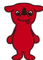
千葉県マスコットキャラクター チーバくん

( https://www.pref.chiba.lg.jp/kenshidou/fukushi-taxi/fukushi-taxir5.html )