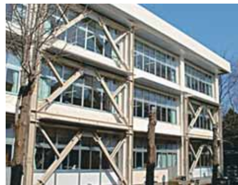
県立千葉聾学校校舎（耐震補強）