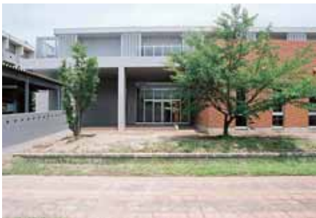
県立保健医療大学図書館棟

平成20年度には、県立保健医療大学図書館棟、県立つくし特別支援学校校舎（高等部棟）等が完成しました。