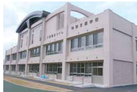
県立つくし特別支援学校校舎（高等部棟）