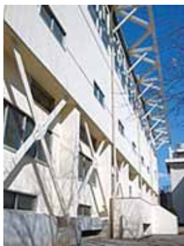
県立船橋東高等学校屋内運動場（耐震補強）

平成20年度は、耐震改修工事として県立船橋東高等学校屋内運動場、県立千葉聾学校校舎等を施工しました。