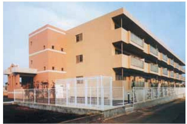
特定優良賃貸住宅（ロアジール上山：船橋市）