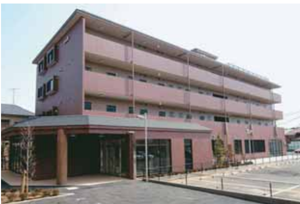
高齢者向け優良賃貸住宅（サウスコート・スカイ：市川市による事業）

平成15年度以降については、福祉施策との連携や地域の実情に対応した事業展開を図るため、市町村が主体となって事業の促進を図ることとし、平成20年度末までに36戸（旭市、市川市）建設されました。