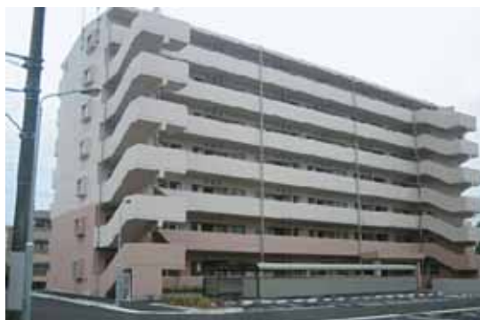
海神県営住宅（船橋市）

県営住宅では、入居者の募集・決定、住宅の修繕、同居の承認など、事務の一層の効率化と入居者へのサービス向上を図るため、平成18年4月に公営住宅法に基づく管理代行制度を導入し、千葉県住宅供給公社に管理を代行させています。