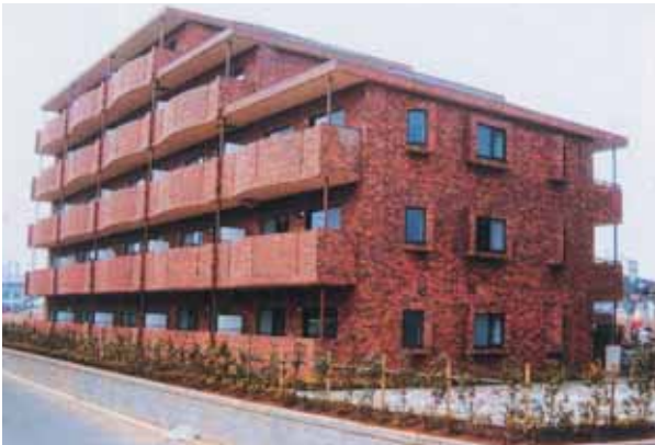
特定優良賃貸住宅（ノーブル東松戸：松戸市）

平成20年度末までに、県全体で6,973戸（県5,735戸、千葉市1,238戸）建設されました。