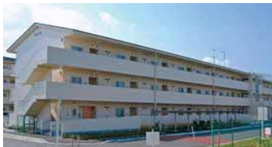
佐倉市大蛇住宅（佐倉市）

昭和26年度の公営住宅法施行以降、平成20年度までに28,293戸建設され、47市町村が22,485戸を管理しています。平成20年度には、千葉市及び勝浦市において26戸（うち借上戸数：25戸）が建設されました。