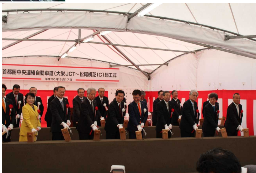
首都圏中央連絡自動車道(大栄~横芝)起工式 → (平成30年3月17日)