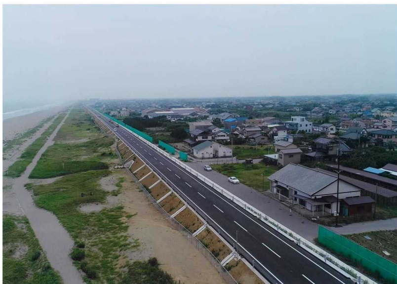
← 九十九里有料道路かさ上げ工事完了 (全線完成:平成29年12月24日)