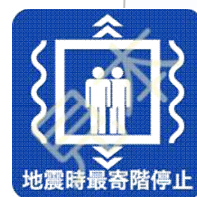
地震時管制運転装置のマーク