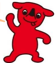
千葉県マスコットキャラクター チーパくん