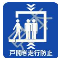
戸開走行保護装置のマーク

戸開走行保護装置、地震時管制運転装置を取り付けたエレベーターに表示することができるマークです。利用者がこのマークを見ることで、そのエレベーターに安全装置が取り付けられていることがわかり、安心してエレベーターを利用することができます。