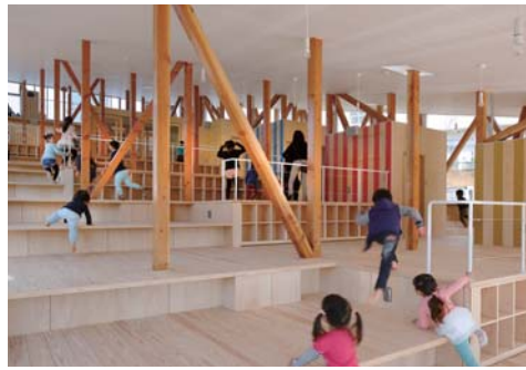
保育園を「大きな家」と捉え、異年齢の子供たちが同じ空間を共有できる空間構成