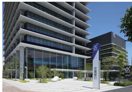
交差点に面して設けた地域の方々との交流の場「コミュニティガーデン」