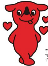
千葉県 マスコットキャラクター チーバくん