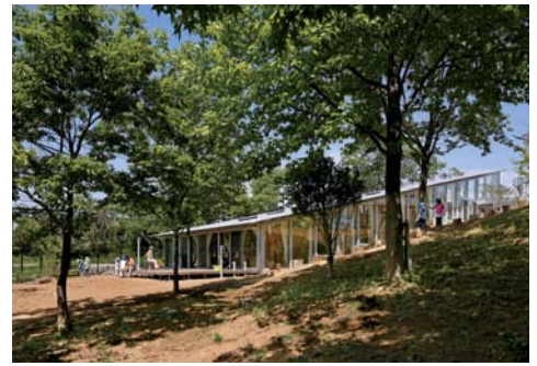
敷地の特徴である南斜面を最大限活かした階段状の保育室