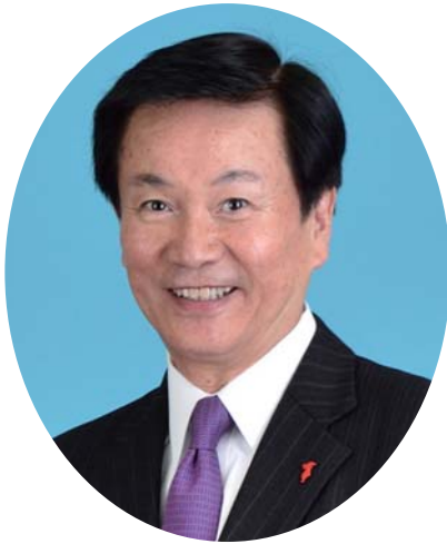
千葉県知事 森田 健作

第22回千葉県建築文化賞に多くの皆様から御応募をいただき、誠にありがとうございました。