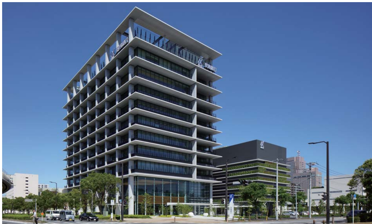
信頼感と親しみやすさを併せ持つ地域に根差した銀行に相応しい新しい顔を創出