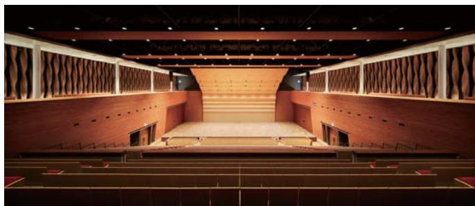
音楽ホールとイベントホールに対応する多目的ホール