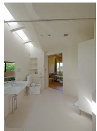
母屋 サニタリー 介護士の意見を聞きながら、変化に柔軟に対応するようプランニングにしている