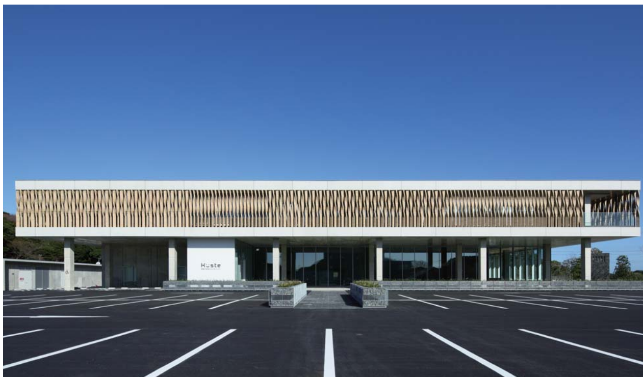
煉瓦ルーバーとピロティがブラインドレスな活動環境を創出