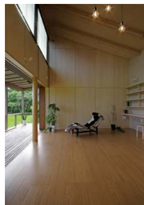
母屋 居間 前面の水田に対して開き、テラスが外部と内部を緩やかに繋ぐ