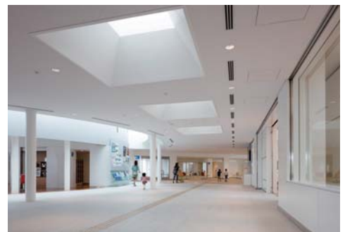
エントラスホール 図書館へのみちゆきに、フリースペース(左)とギャラリー(右)