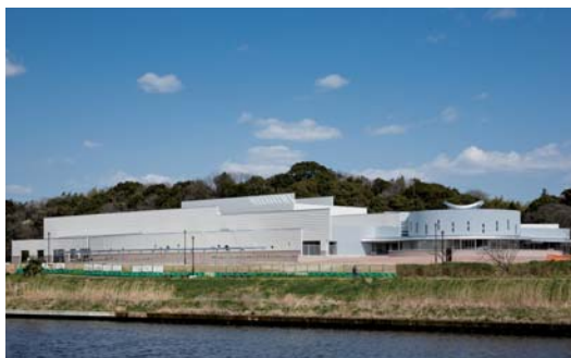
外観 新川側からの全景(新川とともに)