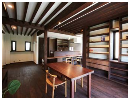
リビングからキッチンを見る