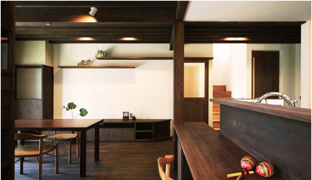
リビング入口を見る