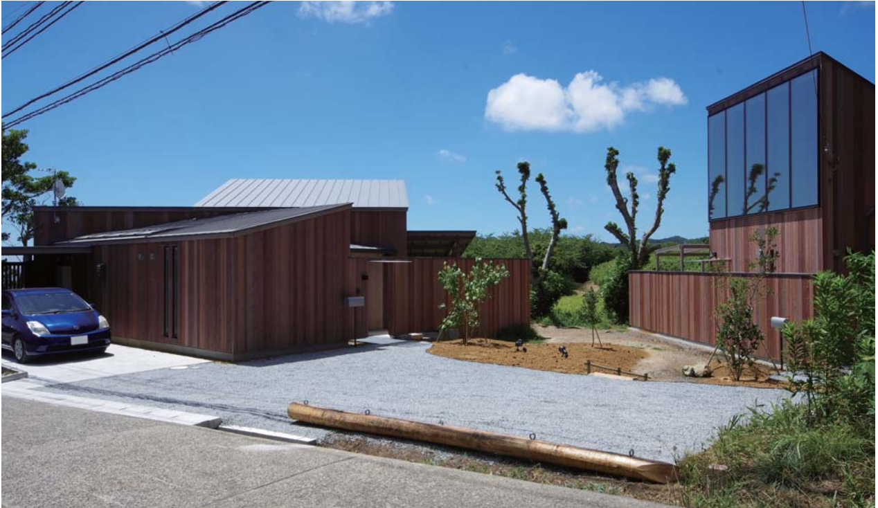
アプローチから見る外観 海を望む自然豊かな傾斜地に計画され、母屋と離れの2棟からなる

夫を妻が介護する高齢夫婦のための平屋の家と2階建ての離れの2棟からなる住宅である。離れには現在、訪問介護の仕事をしている息子が一人で住んでいる。介護現場をよく知る息子と設計者の幸せな共創の結晶である。