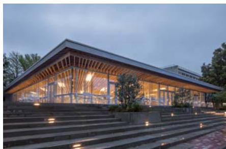
キャンパスに灯りをともす夕景

大学に新しい息吹を吹込んだのは間違いない。学生・教職員のキャンパスライフを充実したものにし、食事だけでなく、授業の合間・放課後も集える活動拠点のひとつとなった。一般の方、高校生も訪れるスポットにもなった。大学の教育活動の広がりを予感させる空間となった。(藤本 香)