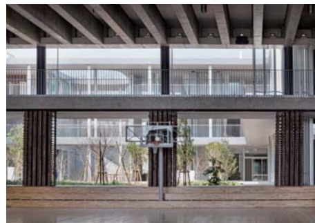
第一体育館より森ののびを見る 折戸を間口いっぱい開けることで風が抜ける