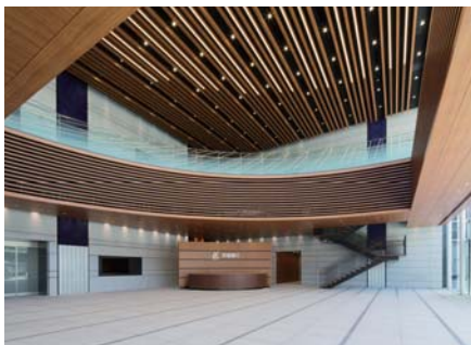
建築空間と融合するアートワークを設けた開放的なエントランスホール