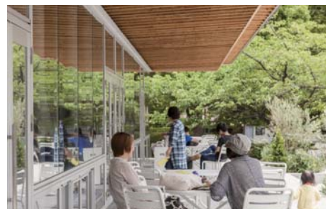
地域の人たちも立ち寄り、ダイニングの軒先