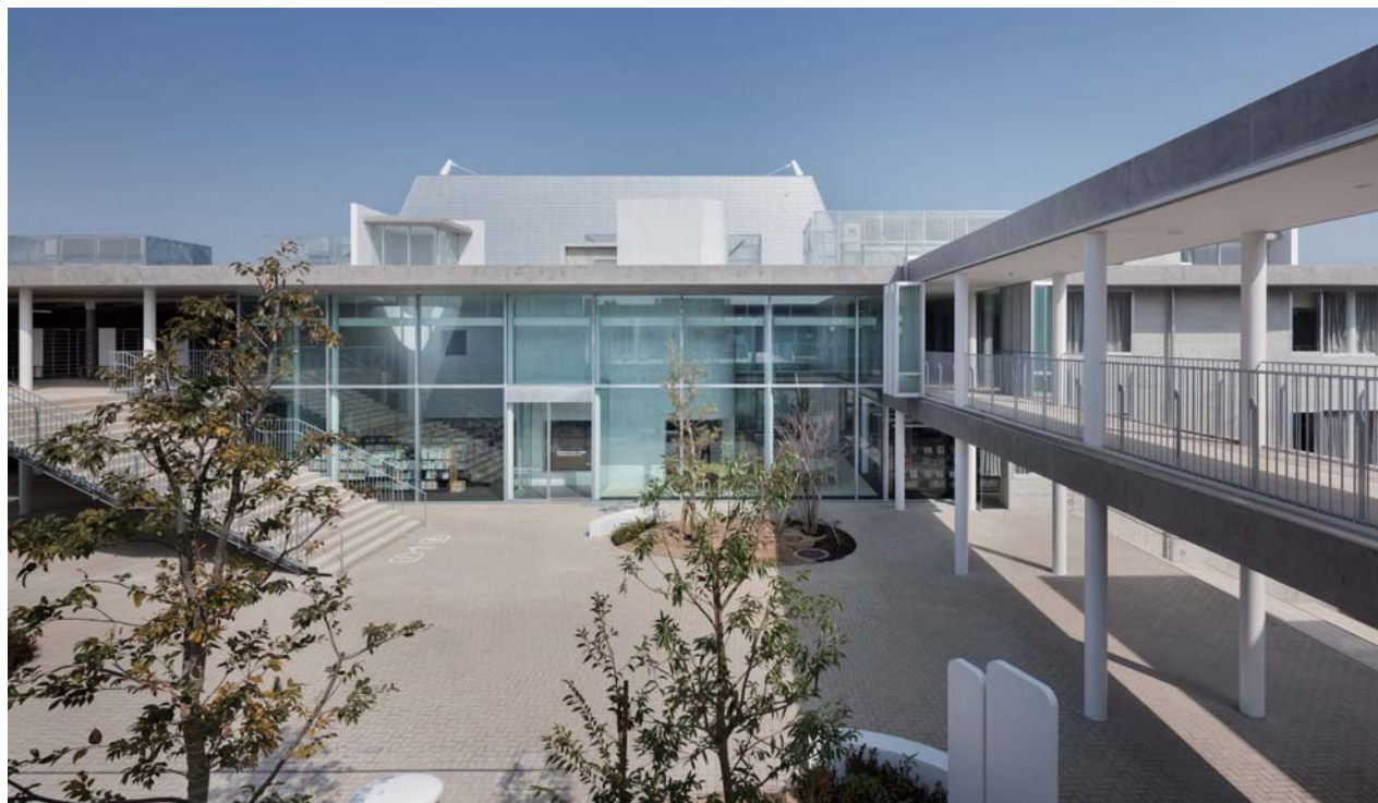
図書館正面 地域住民が利用可能な「こども図書館」と学校の図書館が並ぶ