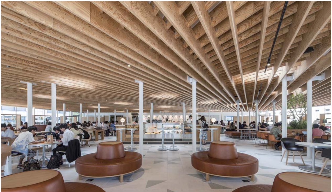
2段の木梁が作り出す心地良いワンルーム空間