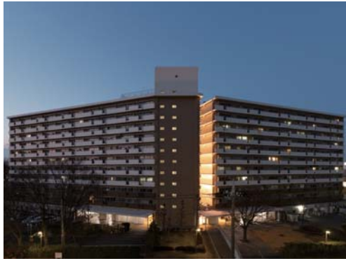
南側より住棟全景