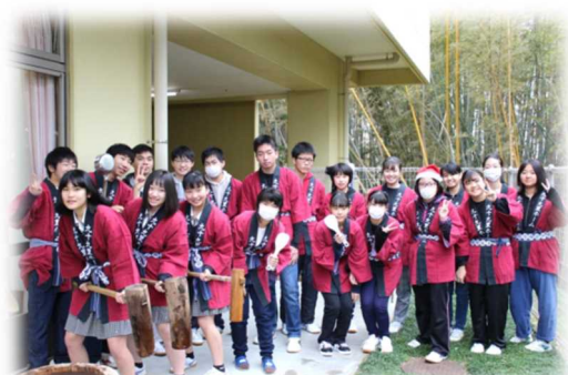
もちつき会のボランティア

病院や老人ホーム・こども園などの受け入れ施設は学校とのつながり・気づきの確認、事前・事後教育など、プログラムの内容に積極的に取り組みます。