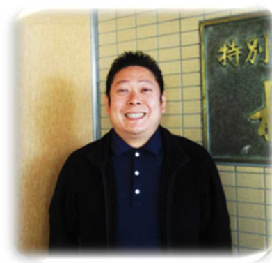
しょうきゅうえん 特別養護老人ホーム松丘園

松丘園は、県内でも有数の規模と長い歴史のある老人ホームです。そして利用者、家族、職員同士も笑顔で楽しく安心して過ごせるような行事や取り組みを大勢の学生やボランティアの皆さんと共に行っています。 中高校生の皆さん、気楽に見学や体験に来てください。