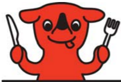
千葉県マスコットキャラクター チーバくん