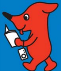
千葉県マスコットキャラクター チーパくん