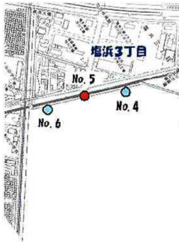
ボーリング調査位置図