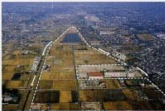
国分川調節池建設予定地