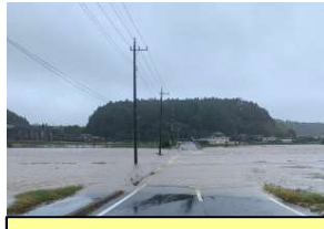
【令和元年】山武市矢部付近浸水状況