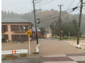
【令和元年】山武市椎崎付近浸水状況