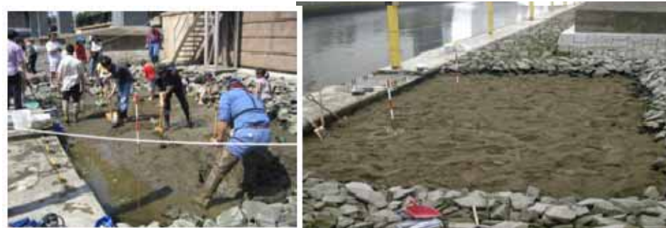
芝浦アイランド、テラス型干潟の造成事例

具体的には、底質としては、細砂～泥混じり砂程度、水深については、LWL 0～1m位の範囲で2,3段のテラス状の試験場(4×8m程度)での実験が良いと思います。干上がった時に完全に排水してしまうと条件として厳しすぎると思いますので、ある程度の保水ができる構造になっている必要があります。モニタリングは、実験場と隣接する対照区(船橋海浜公園?)で、生物生息量や地形変化、底質変化などを中心に行うと良いとおもいます。また、こうした場を囲んでいる構造物に定着する生物、隙間に住む生物などが期待できますので、モニタリング時には、そうした構造物周辺の生物の観察も合わせて行うと良いと思います。