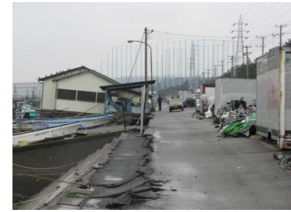
漁港施設の傾斜 舗装面の沈下・亀裂