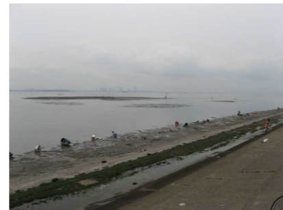
干潟の干出域が縮小