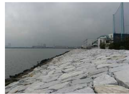
【塩浜2丁目護岸】 目立った被害はない