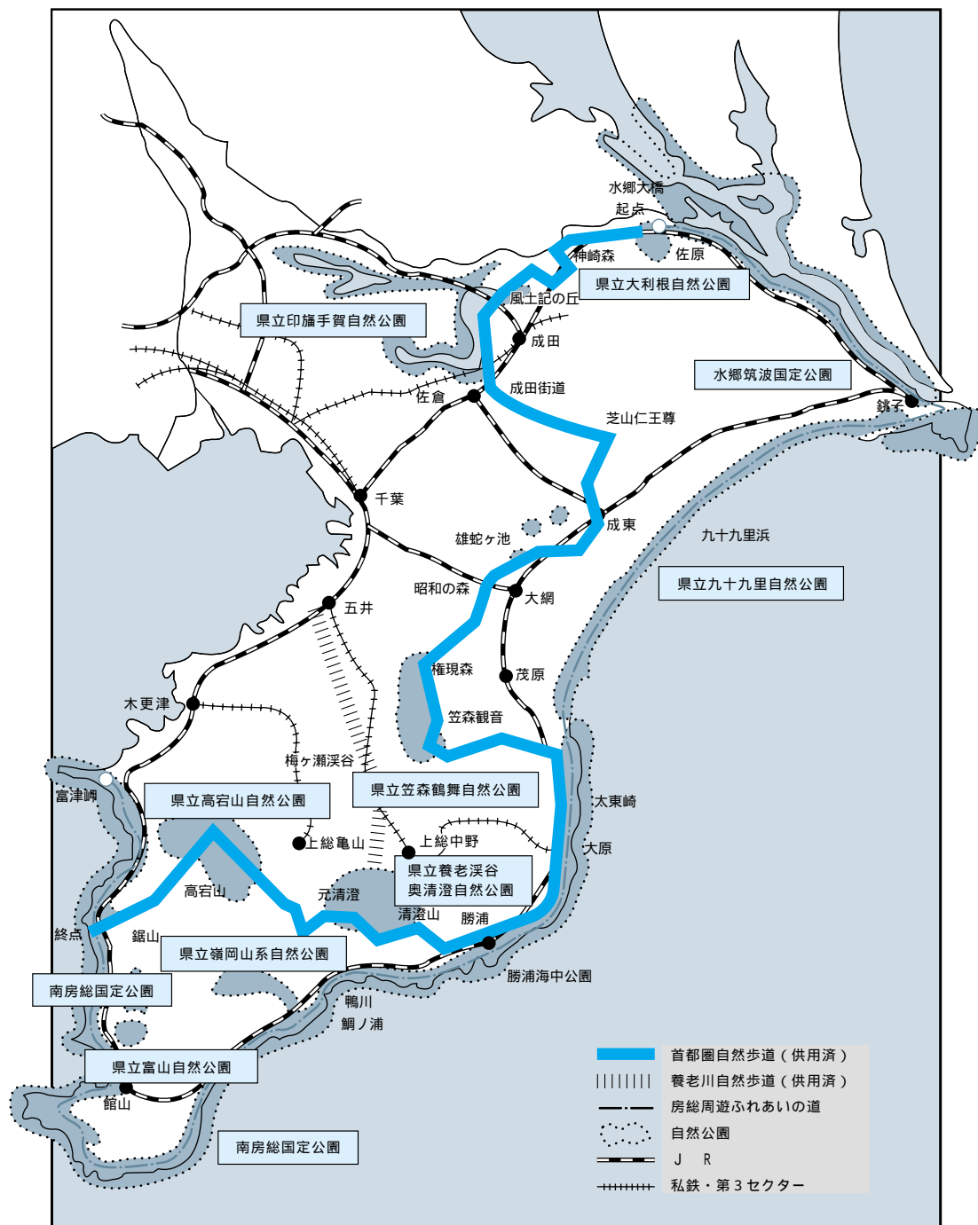
図2-3-2 自然歩道概要図

さらに、首都圏自然歩道に接続して、富津市から海沿いに房総半島を一周して佐原市に至る約280kmの房総周遊ふれあいの道のうち、富津市から館山市までの50kmの区間を9年度から着手している。