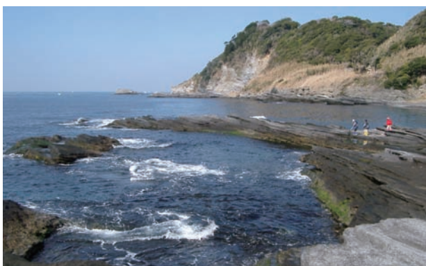
大房岬（南房総国立公園）

自然環境は、人々の生活・文化の基盤であり、人・自然・文化が一体となった健全な生態系は、多種多様な生物とそのかかわりの連続性によって維持・継承され、豊かな人間社会を育んできました。この大切な生物多様性と生態系を守り伝えるため、4年にブラジルで開催された地球サミットでは、「気候変動枠組条約」とともに「生物多様性条約」が採択され、遺伝子、種、生態系の3つのレベルの生物多様性の保全・再生が謳われました。日本は、5年にこの条約に加盟するとともに、7年には条約の規定により「生物多様性国家戦略」を策定しました。14年には国家戦略の見直しを行い、「新・生物多様性国家戦略」を策定しました。