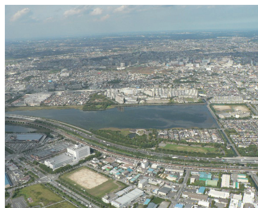
東京湾奥部に残された貴重な干潟・浅海域（左：三番瀬、右：谷津干潟）

東京湾の干潟・浅海域は、そのほとんどが1960年代から1970年代にかけて埋め立てられ、工業用地や住宅用地として開発されました。干潟と浅海域は、底生生物、魚類、鳥類などの重要な生息地です。特に、カモ類、シギ・チドリ類は、はるばる海外から三番瀬や谷津干潟を目指して渡ってきます。