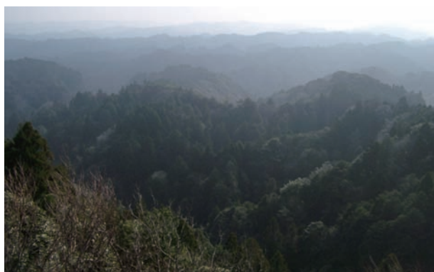
梅ヶ瀬溪谷（自然環境保全地域）

南房総の海岸は、砂浜、磯、断崖などとても変化に富んでいて、南房総国立公園に指定されています。大房岬もその一部です。ビジターセンター、少年自然の家、キャンプ場など、自然との触れ合いの場として整備されています。