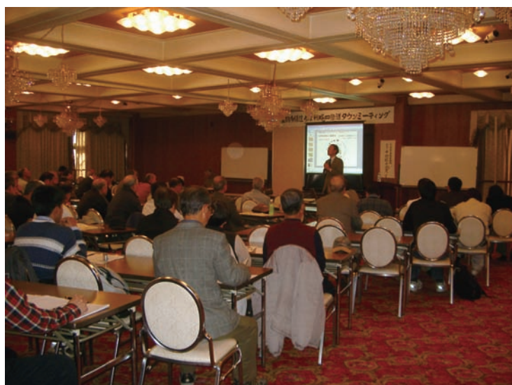
タウンミーティングの様子

戦略の策定に当たっては、広く県民の意見を聴いて、生物多様性が保全されている現場、あるいは損なわれている現場、それぞれの実態を把握した上で、各地域の課題は何かを知る必要があります。そのため、広く呼びかけを行って、それに応じていただいたNPO等によりタウンミーティングの実行委員会を組織していただき、18年10月から地域ごとのタウンミーティングがスタートしました。