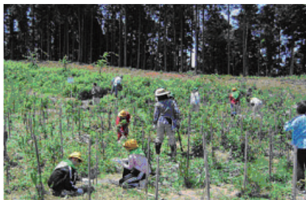
里山フェスティバルでの1日里山体験

里山条例では、里山の大部分が民有地であることから、土地所有者と里山活動団体、双方が安心して里山の整備や活用に取り組めるよう「知事の里山活動協定の認定制度」を設けており、この普及を図るため、県内各地でフォーラムなどを開催