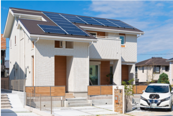
↑省エネ・再エネ設備を備えた住宅「ZEH」

電気自動車の普及や充電環境の整備等に係る企画・立案のほか、県所有の燃料電池自動車を活用した広報など、次世代自動車の普及促進に取り組んでいます。