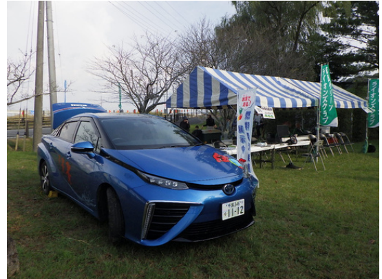
↑各種イベントでの燃料電池自動車の展示