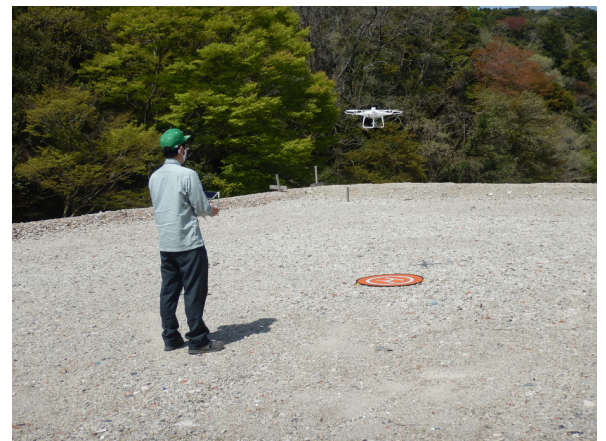
↑ドローンを活用した現場調査