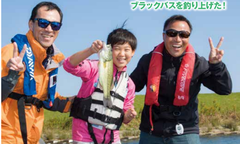
見事ブラックバス釣り上げ、親子で鈴木利忠プロ(右)と記念撮影。ブ口いわく、このサイズは初心者ではなかなか釣り上げられないとのこと。