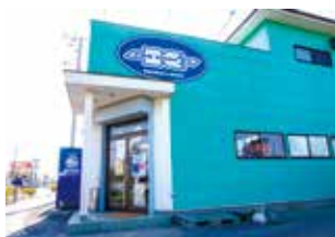
プロショップ ケイズ (佐原店) 千葉県香取市佐原口 2018-1 TEL : 0478-55-1968