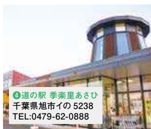
④ 道の駅 季楽里あさひ 千葉県旭市Iの5238 TEL:0479-62-0888