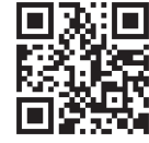
統一河川情報システム