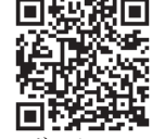
ハザードマップポータルサイト