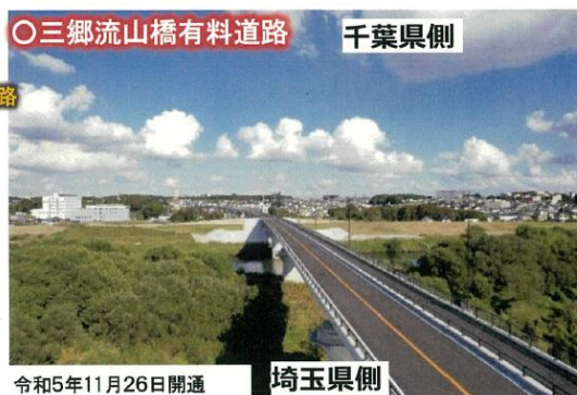
○三郷流山橋有料道路 千葉県側