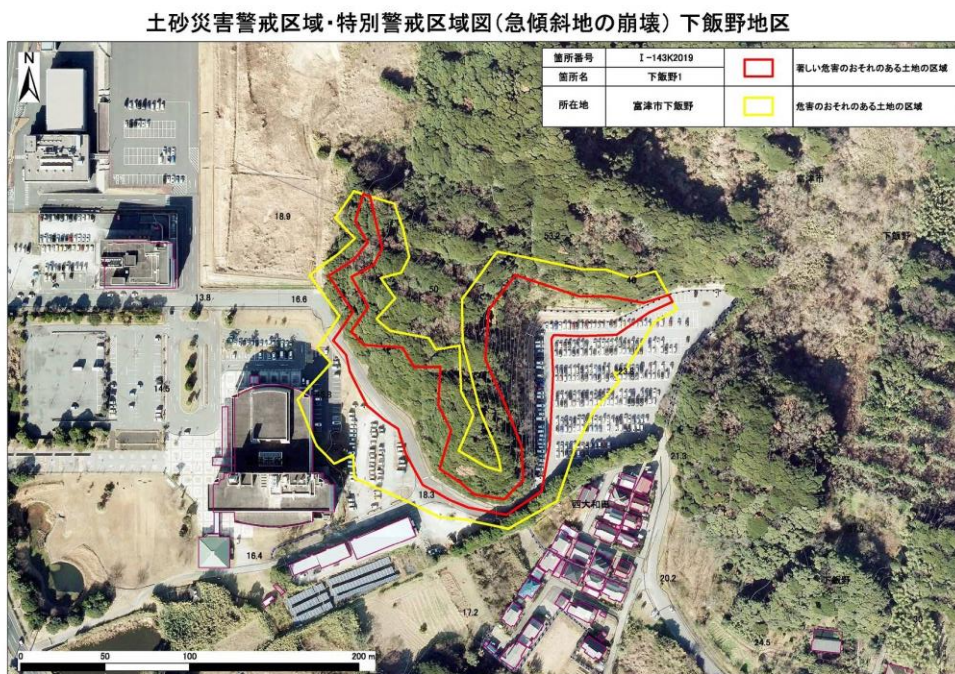
図2 住民周知資料（住民説明資料）（オルソフォト図）