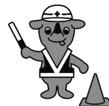
千葉県マスコットキャラクター チーパくん