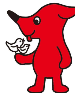
千葉県マスコットキャラクター 「チーバくん」