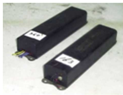
業務用照明器具の安定器