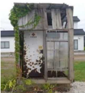
放置されたキュービクル

その他の発見事例はこちらをご覧ください https://www.pref.chiba.lg.jp/haishi/pcb/index.html (千葉県庁ホームページ)