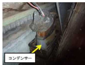
資材に隠れていたコンデンサー